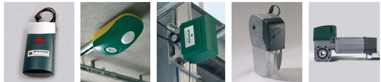
SL650 / SL800