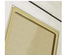
Dorato / Gold-Plated / Vergoldet