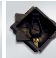
Bronzata / Bronzed / Bronze