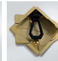
Dorata / Gold-Plated / Vergoldet