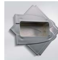
Cromata / Chromed / Verchromt