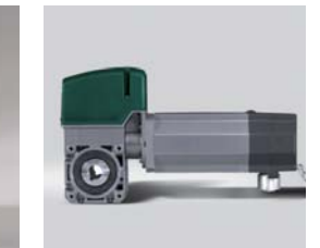
STA1 / STA3

Breda è con voi sempre! Breda dispone di una Rete Vendita altamente qualificata, disponibile per ogni richiesta su tutta l'ampia gamma Breda. Per l'efficienza e la durata del prodotto, richiedere al rivenditore informazioni sulla "manutenzione programmata" (indispensabile per la validità della garanzia).