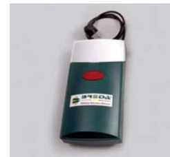
SL650 / SL800