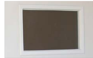
Bianco / White / Weiß