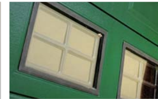
Nero / Black / Schwarz