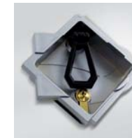
Cromata / Chromed / Verchromt