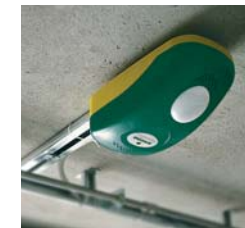
V800E / V800PLUS