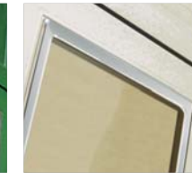
Cromato / Chromed / Verchromt