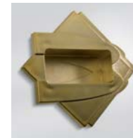
Dorata / Gold-Plated / Vergoldet