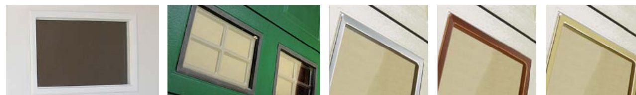
Bianco / White / Weiß Nero / Black / Schwarz Cromato / Chromed / Verchromt Bronzato / Bronzed / Bronze Dorato / Gold-Plated / Vergoldet