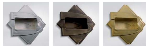
Cromata / Chromed / Verchromt Bronzata / Bronzed / Bronze Dorata / Gold-Plated / Vergoldet