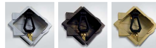
Cromata / Chromed / Verchromt Bronzata / Bronzed / Bronze Dorata / Gold-Plated / Vergoldet