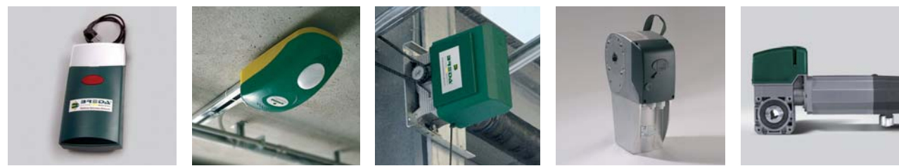
SL650 / SL800