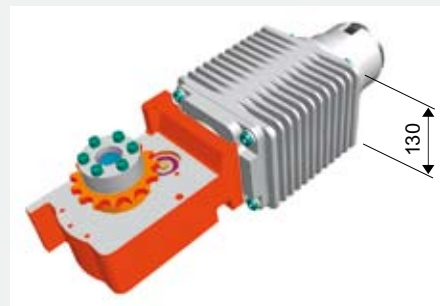
Unità motore riduttore Universal Drive 5201