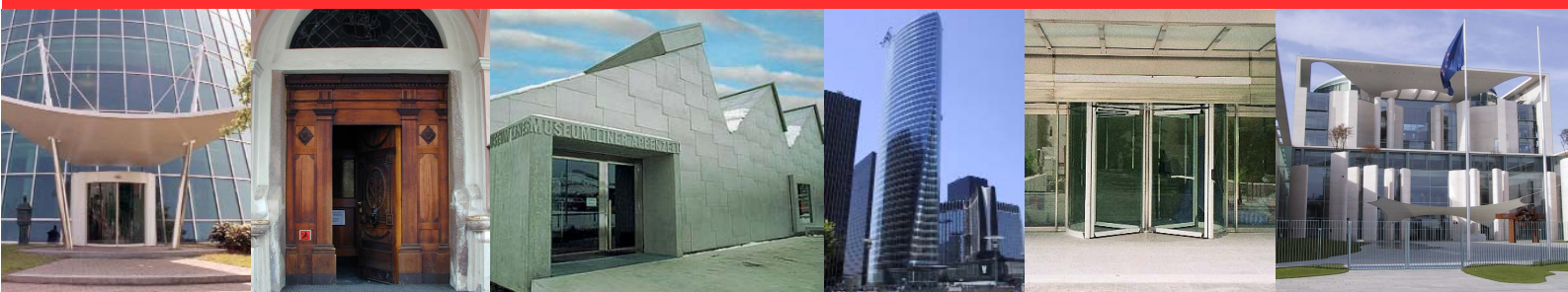
Repro 68 Hamburg Chiesa Ortisei Trento

Potrete ordinare le nostre porte in tutto il mondo. Il nostro più vicino rivenditore sarà lieto di offrirvi una consulenza personalizzata.